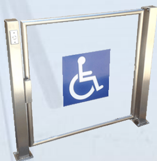
Puerta de servicio