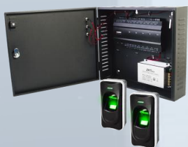
Tarjetas de proximidad